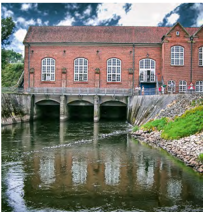
Det gennemsnitlige smolttab ved vandkraftværker er så højt som 82 %.