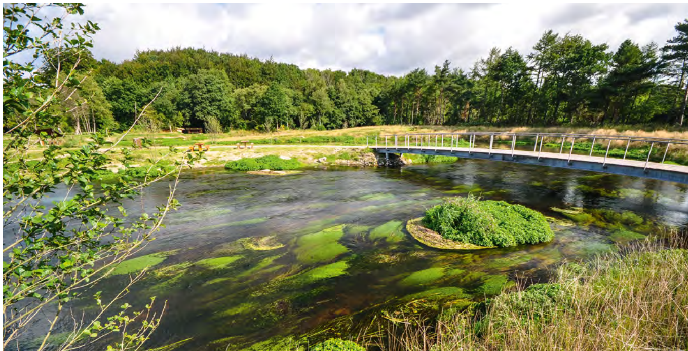
De store vandløb er også værdifulde. Dette stryg i Vejle Å producerer årligt flere hundrede ørredsmolt.

Dvs. at selv uden at medregne medfinansiering fra EU er der en stor gevinst for samfundet ved en miljøindsats i ørredens gydevandløb, hvis en del af den øgede ørredbestand bliver fanget som havørreder af lystfiskere.