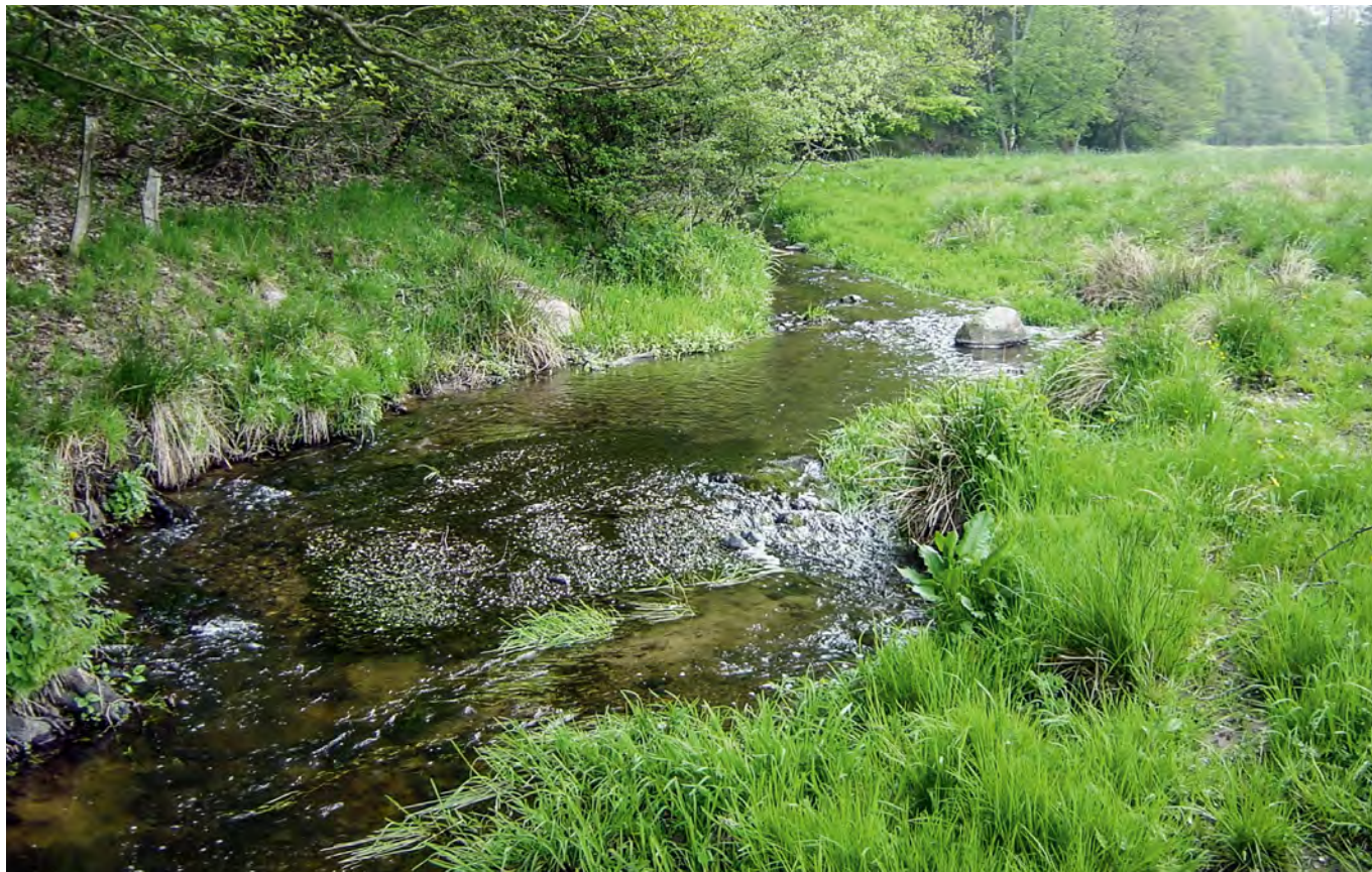
De små ørredbække har stor værdi for samfundet. Produktionen af havørredyngel i en god ørredbæk skaber en årlig omsætning ved lystfiskeri efter havørred et sted i Danmark på mindst 283.000 kr pr. km gydevandløb.

højt (Hasler et al. 2016) – men indtil videre er der ikke beregnet andre referencetal for værdien af det danske havørredfiskeri.