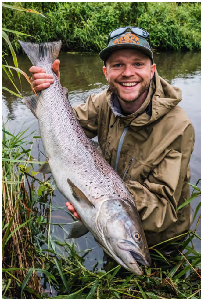
Værdien af en lystfiskerfanget havørred, som tages med hjem, vurderes at ligge mellem 1.000 kr og 2.500 kr per kg.