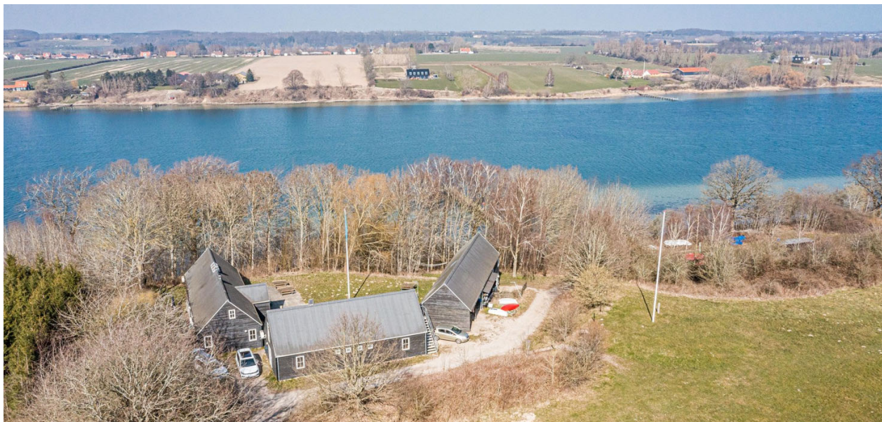
Luftfoto af Thurøbund Spejdercenter